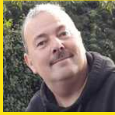
Autor: John Langerak